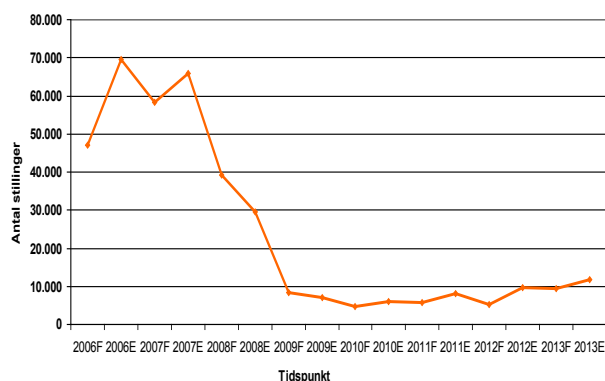
Figur 2 Udviklingen i mangelsituationen, 1. halvår 2006 - 2. halvår 2013

Billedet af en forbedret konjunktursituation understøttes af, at det især er indenfor den private sektor, herunder bygge- og anlægssektoren, IT-sektoren og indenfor jern-, metal- og autosektoren, at der kan konstateres et stigende antal forgæves rekrutteringer ift. den seneste undersøgelse, jf. senere.